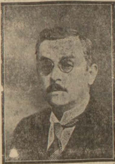
Ökonomi Bakanı Celâl Bayar

Günde Sekiz saat Çalışma olacak, Kanuna tabi müesseseler tesbit edildi